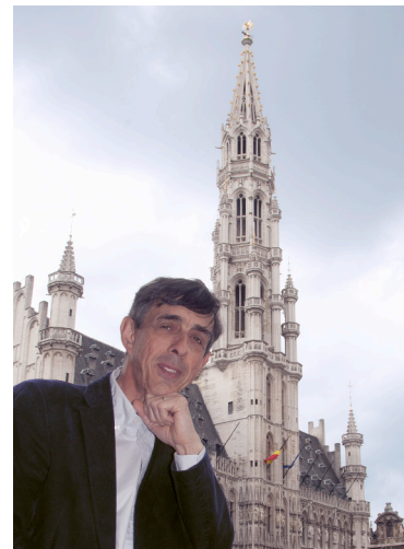
Editeur responsable: Alain Maskens, Avenue Lambert 62, 1200 Bruxelles. Conception et réalisation: www.morandunlogiciel.be